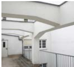
Zugang zu Wohnungen